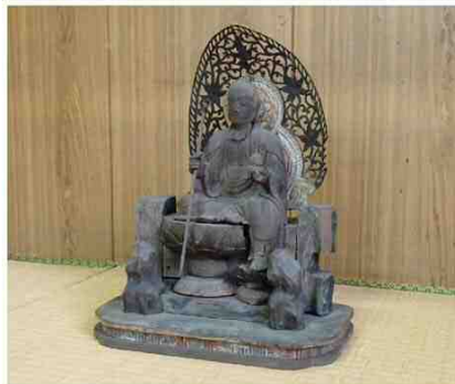
木造地藏菩薩半跏像 (芝園町二丁目町内会蔵)