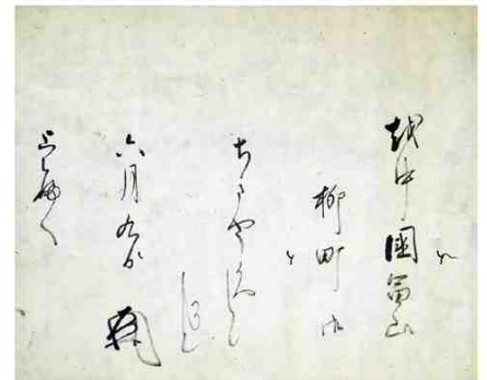
【写真展示】足利義教御内書 (二尊院蔵)

会期 平成26年12月13日(土)～平成27年3月1日(日) 会期中の休館日 12月28日(日)～1月4日(日) 開館時間 9:00～17:00(入館は16:30まで)